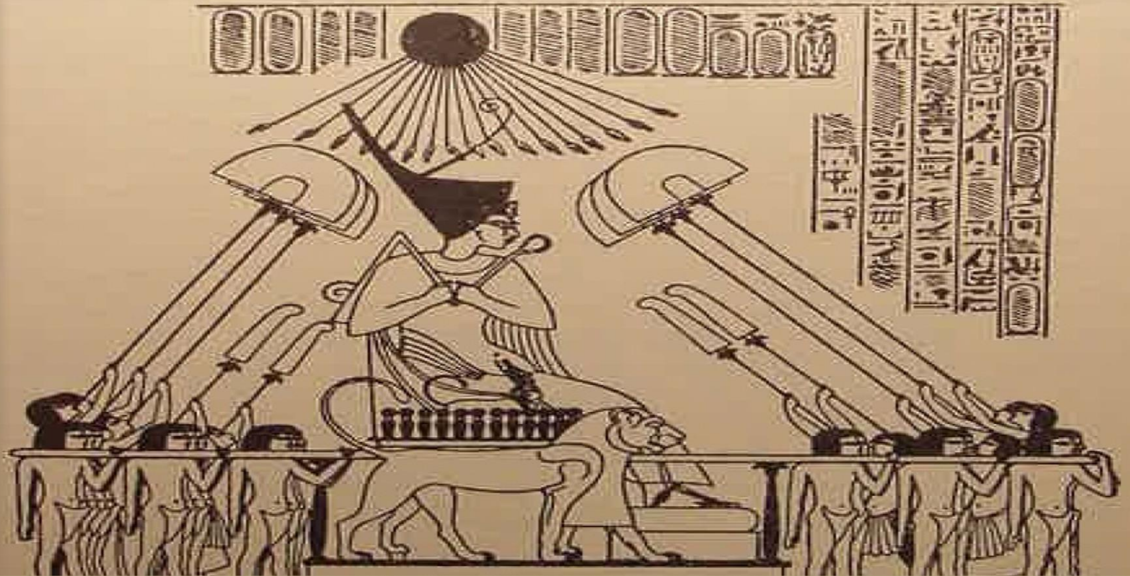
Faraón Akhenaten, ca. 1350-1334 AEC, 18va Dinastía, en un trono portátil. Note la esfinge alada parada encima del león.